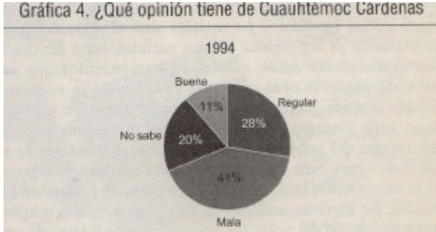
Gráfica 4.- ¿Qué opinión tiene de Cuauhtémoc Cárdenas?